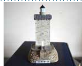
表 紙 の 灯 台

Kermorvan (ケルモヴァン) 灯台。 四角くてたくましいボディの上に、優しい瞳が 乗っています。海側は白く塗られていますが、 陸側は石積み質感を残し、見る角度で表情 を変えます。この灯台はフランス北西部の小さ な港で船を見守るように建てられています。私は映 画「灯台守の恋」のロケ地となったウェサン島 に向かう際、この港を訪れました。 冬場、この海域はとても荒れるため難破する船 が絶えなかったようです。そのため多くの灯台 が岩礁の上に建てられているので、船に乗ると きは双眼鏡をお持ちください。夏は一転して穏 やか。浮標の上で海鳥が羽を休めています。 灯台名鑑 (P.6) も合わせてお楽しみください。