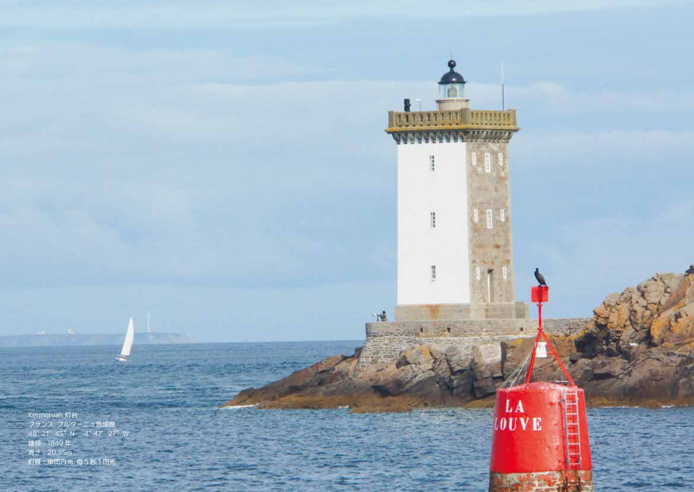
Kermorvan 灯台 フランス ブルターニュ地域圏 48° 21' 45" N _ 4° 47' 27" W 建設：1849年 高さ：20.35m 灯質：単閃白光 毎5秒1閃光