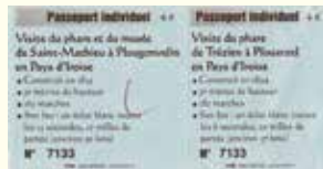
フランス・サンマチュール灯台のチケット ※フランス語ってだけでお洒落に見えます。

さて、灯台本を読むときに挟む葉はどのようなものか考えました。灯台の絵を描いて手作りしようか とも思ったのですが、私は一度に数冊同時に読むタイプなので、たくさん必要なんです。そこで度いいもの を見つけました。参観灯台で寄付金を支払うといいただけるチケットです。大きさも紙質もまさに適切。 灯台本を読みつつ、実際に登った灯台とイメージを重ね合わせたり、一緒に行った人のことを思い出してみたり …。本の世界と実際に訪れた灯台での思い出がオーバーラップして、素敵な灯台読書タイムとなるのでは ないでしょうか。そして来たる11月1日は灯台記念日。灯台関連のイベントも沢山あります。秋は灯台を訪ね、 そして灯台本を読んで過ごしませんか？ あ〜本当に早く秋にならないかなあ。暑いよあ。