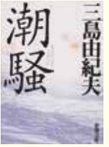
潮騒 三島 由紀夫 著 新潮文庫

鳥の素朴な若者の純恋愛 にわくわくしすぎる一冊。 舞台となった歌島は三 重県の神島をモデルとし ています。出てくるのは生 活の一部系灯台。漁村の人 の生活に根ざした現役の灯 台です。漁師の青年と海女 の少女とどいつの灯台は常 にそこにある、日常の風景。 しかし、そこであまちゃん で有名な「潮騒のメモリー」 の「きりてよよ」その火 を」とびこえてく♪」が緑 り広げられるのです…。