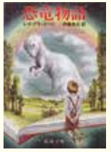
恐竜物語 レイ・ブラッドベリ 著 伊藤 典夫 訳 新潮文庫

恐竜にまつわるSF小説 の短編集。その中の一話「霧 笛」が灯台本です。深さ 二十マイルの孤獨な海の底 に住む太古の生きもの。そ の目に、海岸に佇む巨大な 塔はどう映るのか。「光の 尾をふりまわし、塔の高い 喉くびりでは霧笛がうなり声 をあげている」姿はまさに 恐竜系灯台！迫力のシー ンは、文章で読んでも自然 と頭の中に映像が浮かびま す。冒頭からは想像できな いほど静かなラストでは、 とても切ない気持ちに…。