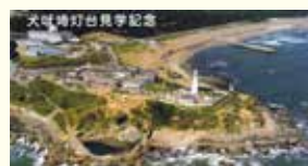
犬伏崎灯台の見学記念 ※燈光会が管理する登れる灯台ではこのような記念チケットを。