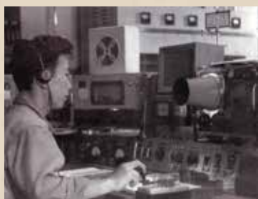
えりも岬灯台 1965年ごろ

が、回転装置の調子が悪くレン ズが回りません。父だつたらす ぐ直せるものでも、母では手が でませんでした。そこで私と弟 がレンズを素手で直接まわすこ とになりました。私は小学校低 学年、弟は5歳くらいだったん じゃないでしょうか。何秒に何 閃光なんて計つていられなく て、一心不乱に重いレンズを回 しました。そのうちに弟は泣き 出しましたが、それでも励まし 合いながら父が帰つてくるまで 回し続けました。