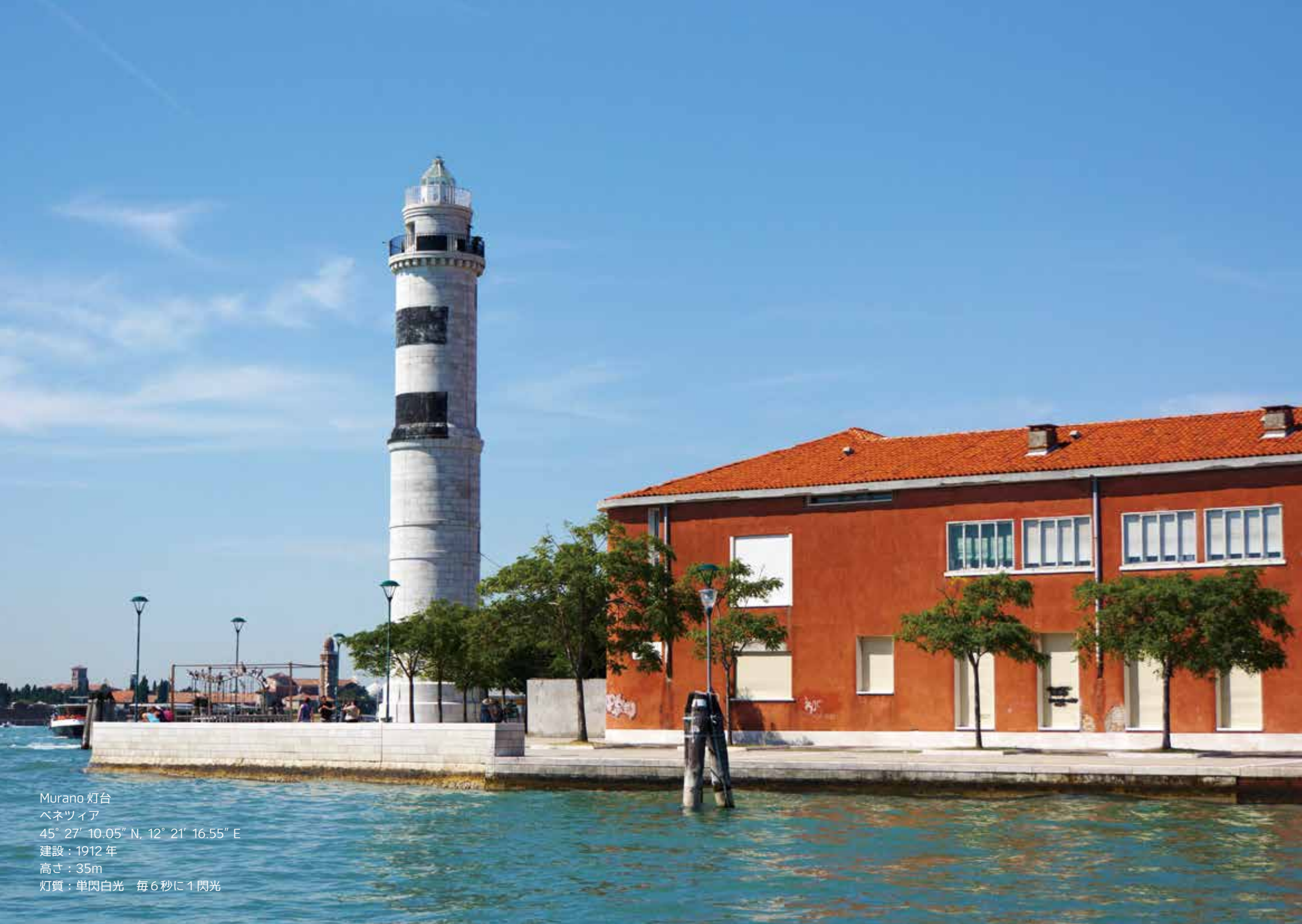
Murano 灯台 ベネツィア 45° 27' 10.05" N, 12° 21' 16.55" E 建設：1912 年 高さ：35m 灯質：単閃白光 毎 6 秒に 1 閃光