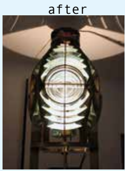
まばゆい閃光に テンションMAX