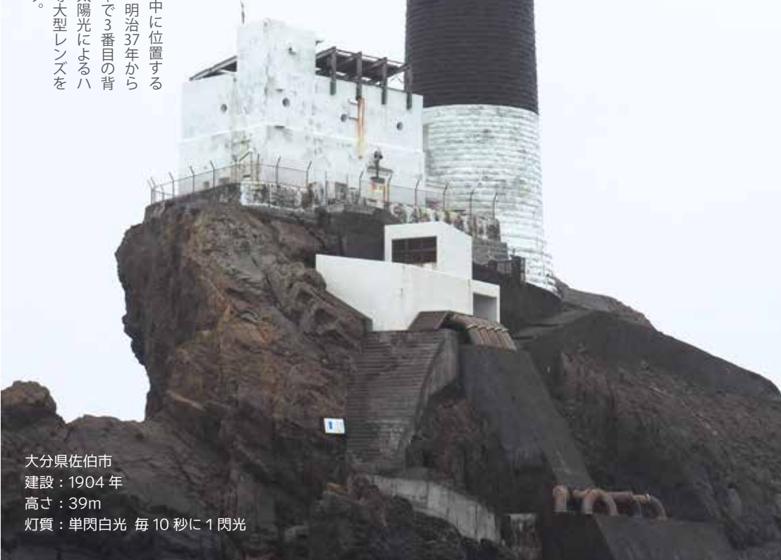
大分県佐伯市 建設：1904年 高さ：39m 灯質：単閃白光 毎10秒に1閃光

大分県豊後水道の真ん中に位置する岩礁に建てられた灯台。明治37年から運用されています。日本で3番目の背の高さを誇り、波力と太陽光によるハイブリッドな発電で3等大型レンズを美しく点灯させています。